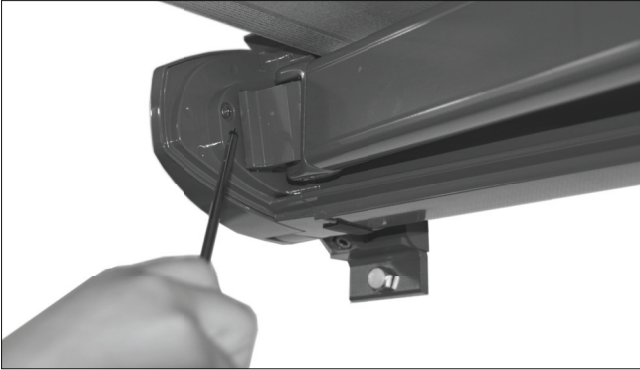
Abb. 1: Lösen der Schraube