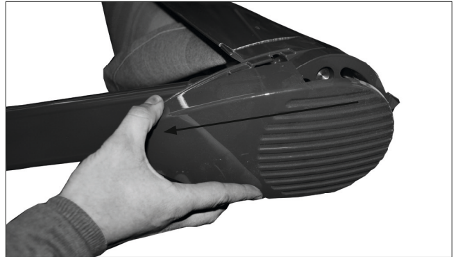
Abb. 2: Kappe abziehen