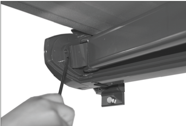
Abb. 2: Lösen der Schraube