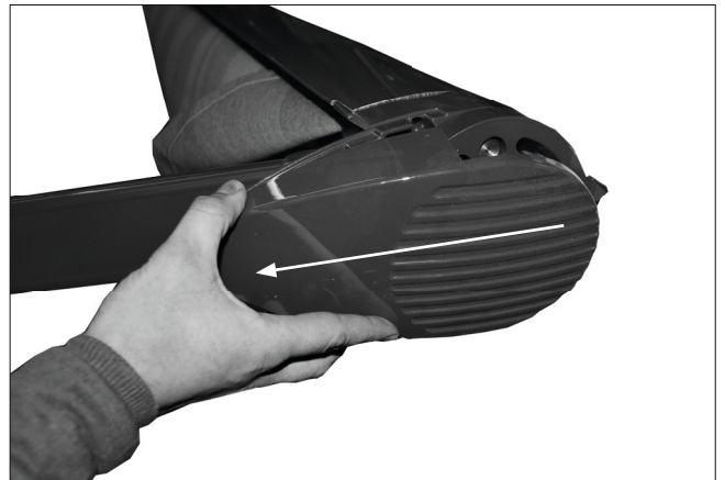
Abb. 3: Kappe abziehen

*Der Motor-Getriebewechsel kann auch im eingefahrenen Zustand erfolgen, z. B. bei defektem Motor /Getriebe. In diesem Fall ist ein Austausch nur durch das Zerstören der Seitenkappen möglich, da hier die Schrauben im geschlossenen Zustand nicht erreicht werden können. Dabei müssen die Arme und die Fallschiene zwingend mit Spanngurten oder ähnlichem gesichert werden.