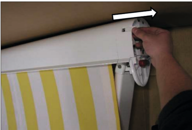
Abb. 6 Lösen der Schraube