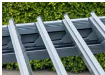
Lamellen ca. 70° geöffnet