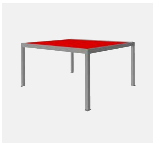
LAMELLENDACH BELLA LAMELLA Ab Seite 6

Offen für alles – geschützt bei allem. Mit einem Terrassendach von Reflexa genießen Sie Ihre Terrasse bei Sonne, Wind und Regen. Ob Pergoladach mit Tuch oder Lamellendach mit Technik – Sie gestalten Ihr Outdoor-Wohnzimmer ganz nach Ihrem Wunsch.