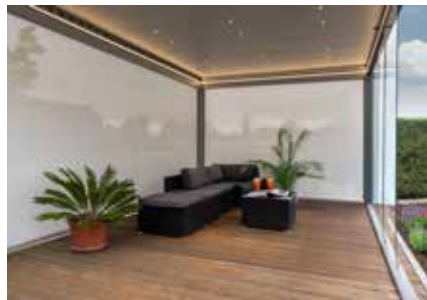
Stimmungsvolle Beleuchtung durch integrierte Spots in den Lamellen oder indirekte Beleuchtung.