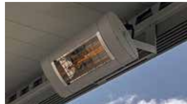
Verlängern Sie den Sommer mit einem Heizstrahler für Ihr Terrassendach.