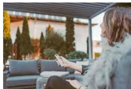
Funkbedienung mit Handsender