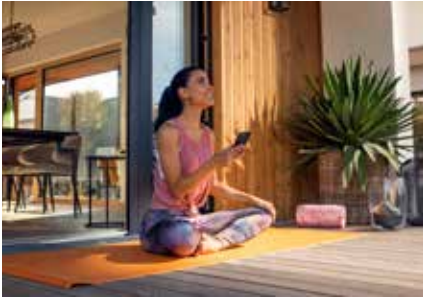
Komfortable Steuerung per Smart Home.