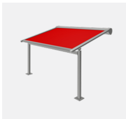
PERGOLAMARKISE VILADORA Ab Seite 8

Moderner, robuster Wetterschutz mit variabler Verschattung durch elektrisch drehbare Lamellen.